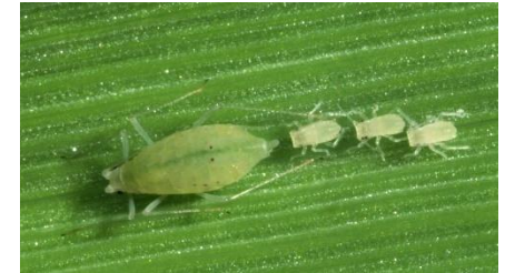
Metopolophium dirhodum (Bleiche Getreideblattlaus)