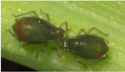
Rhopalosiphum padi (Haferblattlaus)

BYDV / CYDV: verschiedene Virusstämme, die von unterschiedlichen Blattlausarten übertragen werden