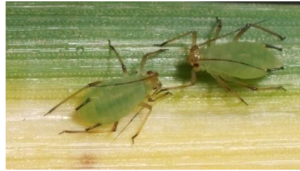
Macrosiphum (= Sitobion) avenae (Große Getreide- blattlaus)