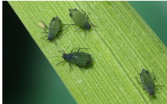
Rhopalosiphum maidis (Maisblattlaus)

BYDV / CDV: verschiedene Virusstämme, die von unterschiedlichen Blattlausarten übertragen werden