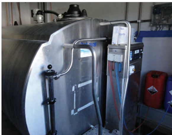
Abb. 5: Milchtank und Reinigungsanlage