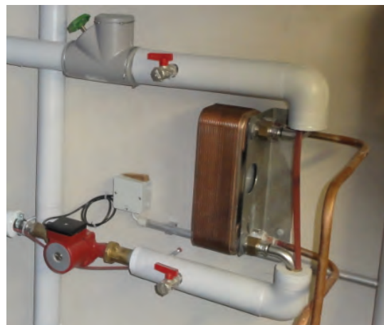
Abb. 6: Plattenwärmetauscher