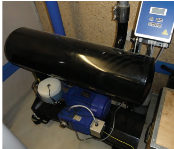
Abb. 4: Frequenzgesteuerte Vakuumpumpe