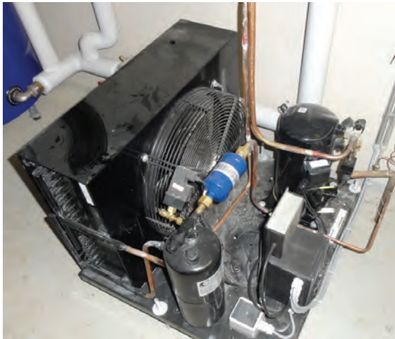
Abb. 3: Kühlaggregat